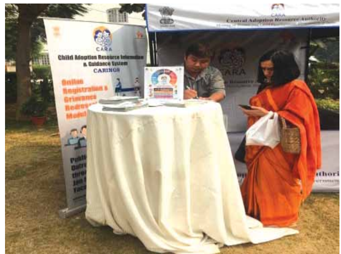
इंदिरा गांधी राष्ट्रीय कला केन्द्र में 26 अक्टूबर से 4 नवंबर, 2018 तक महिला एवं बाल विकास मंत्रालय द्वारा आयोजित राष्ट्रीय जैविक उत्सव, 2018 में कारा