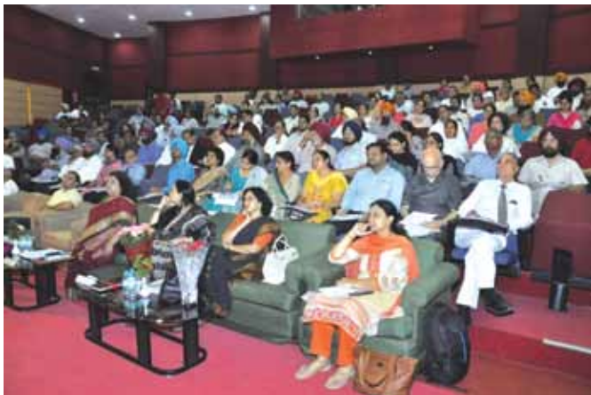
17 सितम्बर, 2018 को चण्डीगढ़, पंजाब में