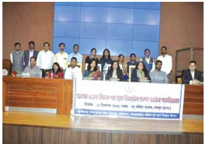
22 दिसंबर, 2018 को रायपुर, छत्तीसगढ़ में