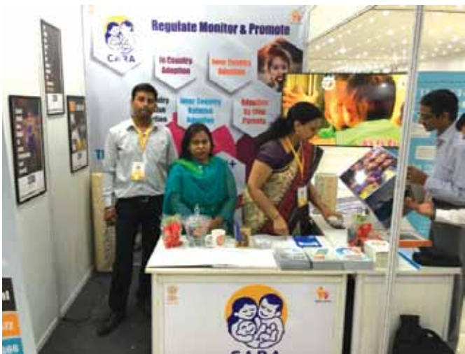
22 जून, 2018 को कारा ने स्कॉच कंसल्टेंसी एंड सर्विसेस प्रा. लिमिटेड द्वारा आयोजित उभरते भारत की स्थिति पर राष्ट्रीय प्रदर्शनी