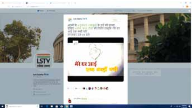
27 अगस्त, 2018 को दत्तक ग्रहण के बारे में लोक सभा टीवी पर प्रसारित 'मेरे घर आई एक नन्ही परी' कार्यक्रम