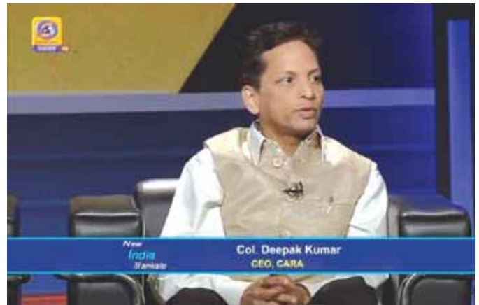
15 नवंबर, 2018 को दूरदर्शन नेशनल पर का 'चर्चा का विषय' कार्यक्रम में न्यू इंडिया संकल्प