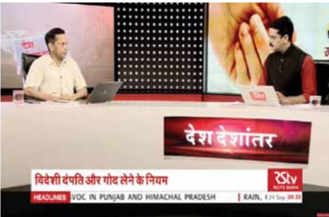
देश देशांतर गोद लेने के नियम और सरोकार दिनांक 24 सितंबर, 2018 को राज्य सभा के चैनल पर दत्तक ग्रहण नियम और सरोकार