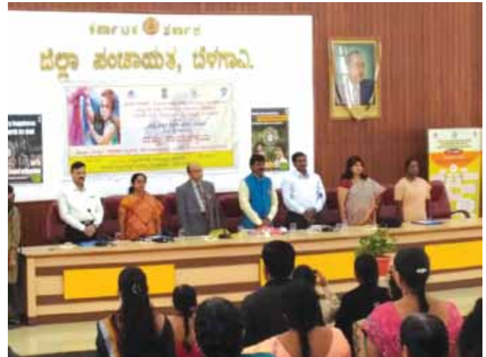
04 जनवरी, 2019 को बेलागवी जिला, कर्नाटक में