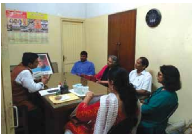
दिनांक 01 सितम्बर, 2018 को बाल देखभाल संस्थान आर्या अंथल्या का निरीक्षण