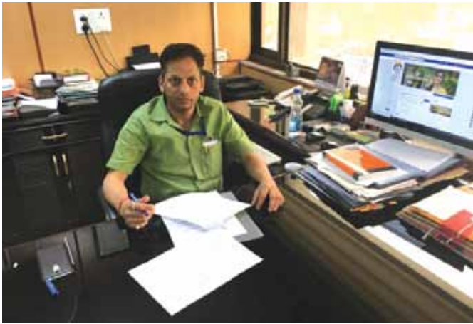
मुख्य कार्यकारी अधिकारी, कारा के साथ सोशल मीडिया पर दिनांक 15 मई, 2018 को आयोजित लाइव प्रश्नोत्तर