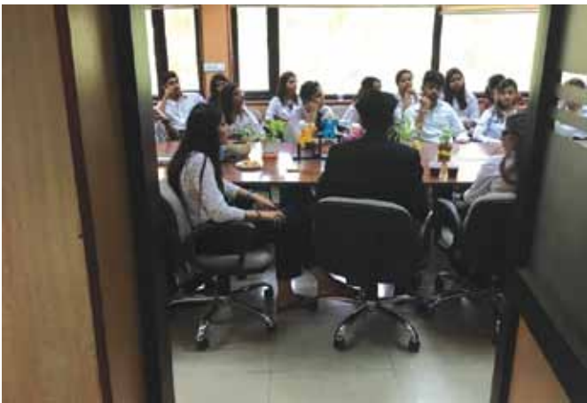
आर्ट ऑफ लिविंग के श्री रिपू सदन, कोलकाता, पश्चिम बंगाल द्वारा माइंड मैनेजमेंट और कार्यालयी पद्धतियों पर एक दिवसीय कार्यशाला