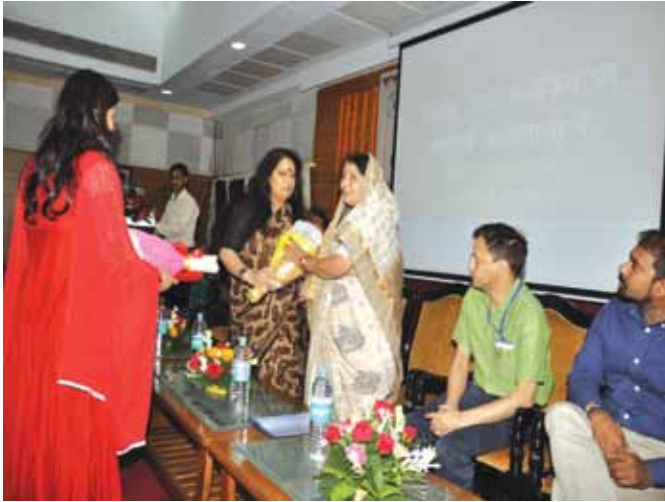
25 और 26 जून, 2018 को रायपुर, छत्तीसगढ़ में