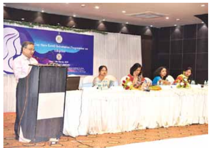
14 मार्च, 2019 को कोलकाता, पश्चिम बंगाल में