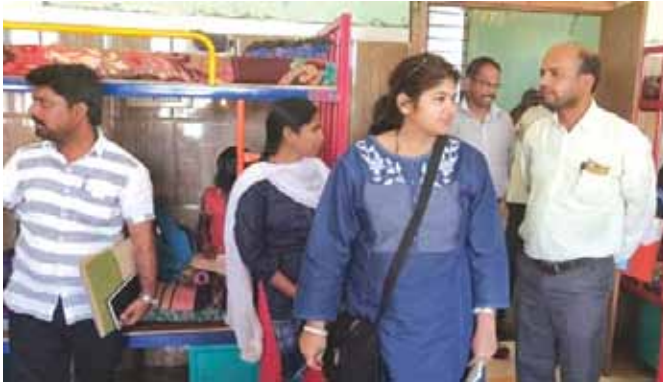
सलाहाकार समिति के सदस्य द्वारा कर्नाटक के कालाबुरागी में एसएए का निरीक्षण