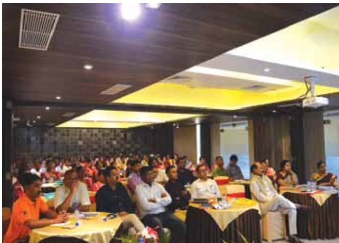
27 नवंबर, 2018 को दीव में