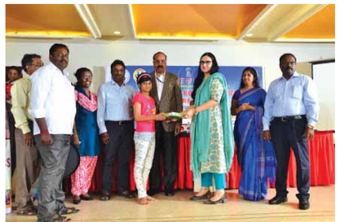
23 जनवरी, 2019 को पुदुचेरी में