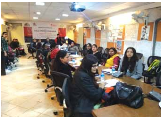
19 फरवरी, 2019 को दिल्ली में