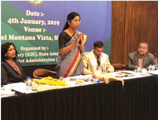
04 जनवरी, 2019 को सिलीगुड़ी, पश्चिम बंगाल में