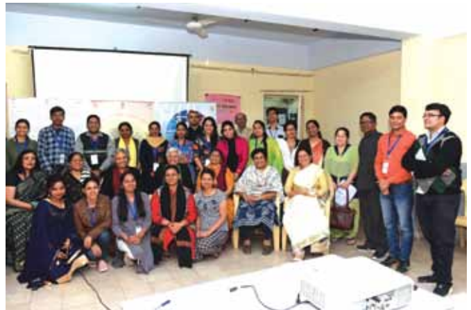
दिनांक 14 से 16 मार्च, 2019 को राष्ट्रीय बाल भवन, नई दिल्ली में दिल्ली के सामाजिक कार्यकर्ताओं की तीन दिवसीय आवासीय कार्यशाला

2.2.3 दिनांक 15 जनवरी, 2019 को उप-समिति की पहली बैठक हुई और इस पायलट परियोजना के तहत दिनांक 14 से 16 मार्च, 2019 तक दिल्ली में तीन दिनों का पहला आवासीय प्रशिक्षण नई दिल्ली क्षेत्र के सामाजिक कार्यकर्ताओं के लिए आयोजित किया गया।