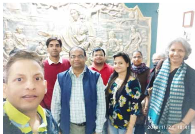
दिनांक 24 नवंबर, 2018 को होली कॉस सोसाइटी, नई दिल्ली का निरीक्षण