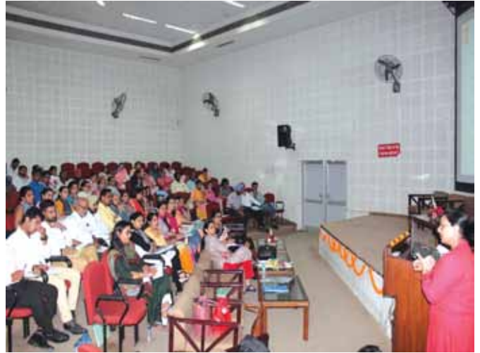
10 जुलाई, 2018 को चण्डीगढ़, पंजाब