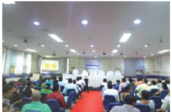
09 अक्टूबर, 2018 को पटना, बिहार में