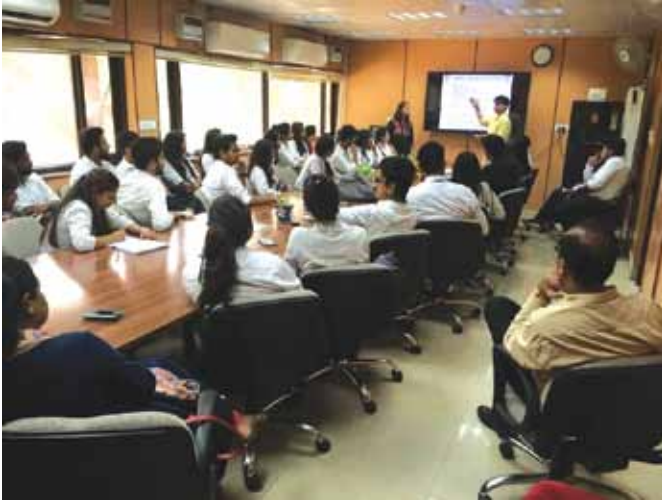
दिनांक 18 सितम्बर, 2018 व 26 अक्टूबर, 2018 को जेईएमटीईसी स्कूल ऑफ लॉ के दूसरे और तीसरे वर्ष के पाठ्यक्रम के छात्रों के लिए आयोजित अभ्यास प्रशिक्षण