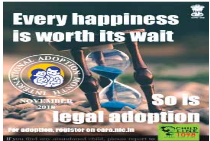
18 नवंबर, 2018 (अंतर्राष्ट्रीय दत्तक-ग्रहण माह) के अवसर पर कानूनी दत्तक ग्रहण पर जोर देते हुए देश भर में 41 समाचार पत्रों में प्रकाशित विज्ञापन