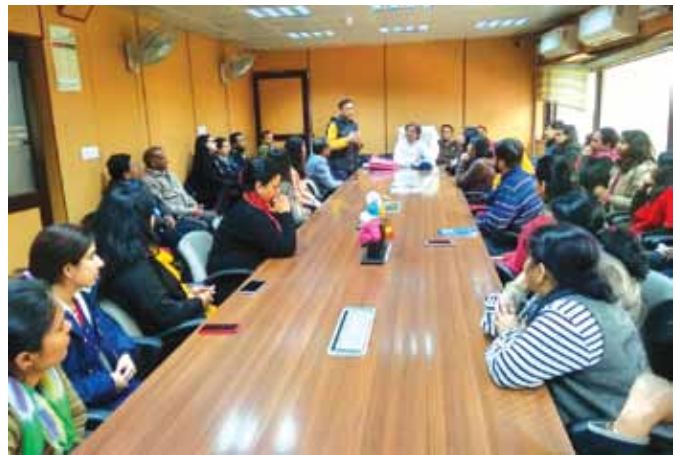
दिनांक 26 अक्टूबर, 2018 को जेईएमटीईसी स्कूल ऑफ लॉ के दूसरे और तीसरे वर्ष के पाठ्यक्रम के छात्रों के लिए अभ्यास प्रशिक्षण