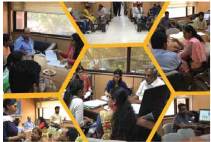
दिनांक 27 अप्रैल, 2018 को भावी दत्तक माता-पिता के लिए जन संपर्क पहल