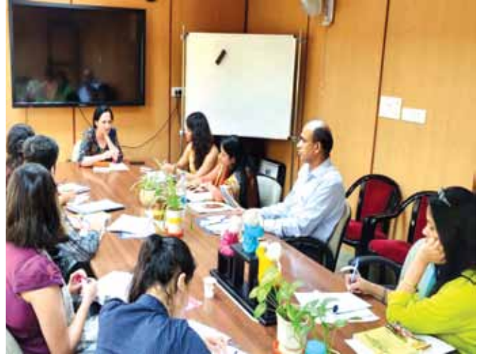
दिनांक 18 अक्टूबर से 25 अक्टूबर, 2018 तक आयोजित सूचीबद्ध संविदा कर्मचारियों का प्रशिक्षण