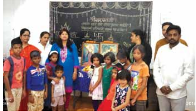
सलाहाकार समिति के सदस्य द्वारा बीदर, कर्नाटक में एसएए का निरीक्षण