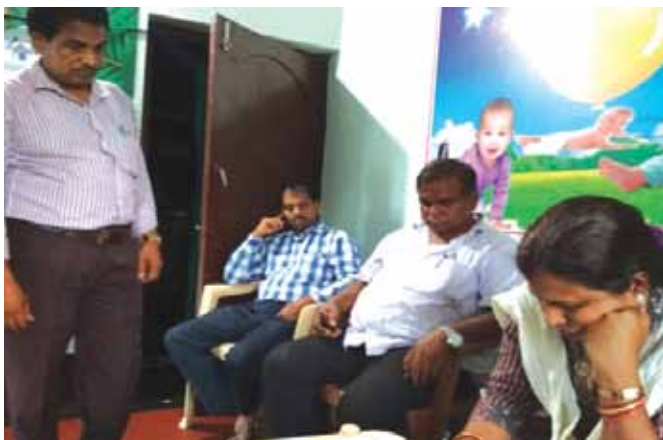
दिनांक 13 अगस्त, 2018 को विशिष्ट दत्तक ग्रहण अभिकरण, पालीश्री महिला समिति, गरापुर, ओडिसा का निरीक्षण