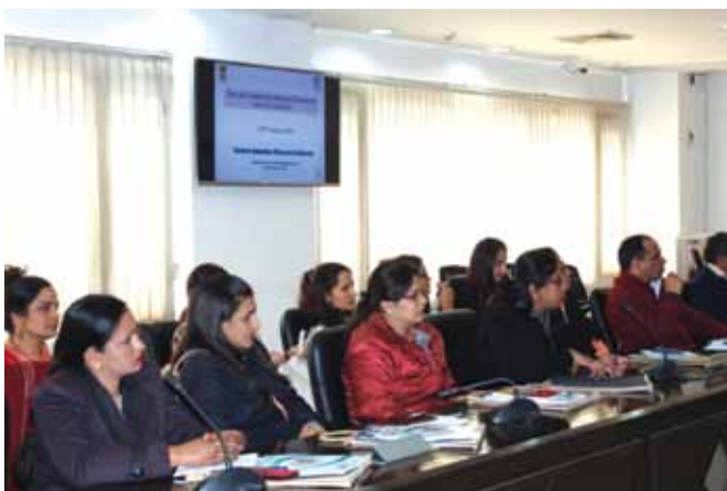
18 जनवरी 2019 को चण्डीगढ़, हरियाणा में